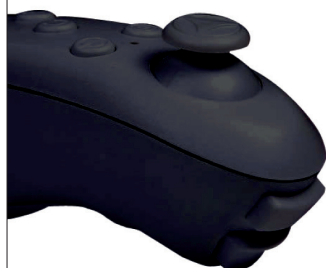
Kontroler Bluetooth dla smartfonów, tabletów i innych urządzeń multimedialnych